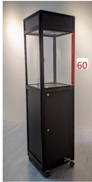
8、玻璃金屬展示櫃-黑 (180cm*45cm*45cm)