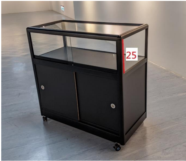
7、玻璃金屬展示櫃-黑 (100cm*100cm*50cm)