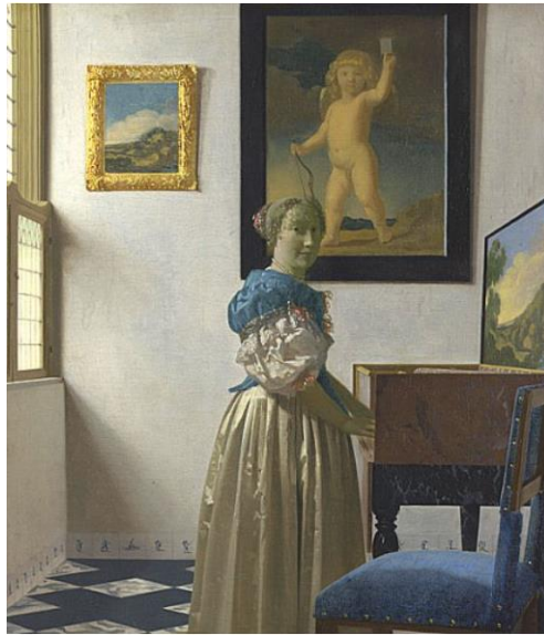
▲ 《站在小鍵琴前的年輕女子》（約完成於 1667 年）

維梅爾早期畫作的特點是尺寸大、明暗對比強烈。從 1656 年起，他的作品開始轉向繪製較小規模的室內場景，展示了荷蘭台夫特市民的日常生活。這些作品大多數描繪寧靜、和諧的家庭生活，他尤其喜歡畫女性的形像和活動。