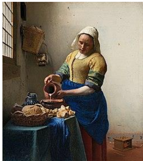
▲ 《倒牛奶的女僕》（約完成於 1660 年）

維梅爾早期畫作的特點是尺寸大、明暗對比強烈。從 1656 年起，他的作品開始轉向繪製較小規模的室內場景，展示了荷蘭台夫特市民的日常生活。這些作品大多數描繪寧靜、和諧的家庭生活，他尤其喜歡畫女性的形像和活動。