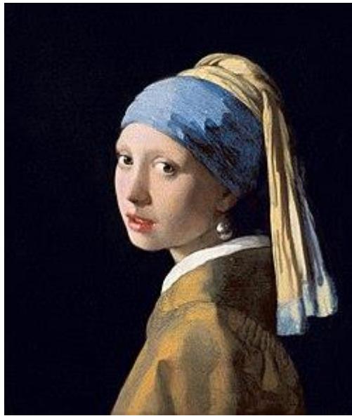
▲《戴珍珠耳環的少女》（約完成於 1665 年）

《戴珍珠耳環的少女》是 17 世紀荷蘭黃金時代畫家維梅爾（Jan Vermeer，1632 年~ 1675 年）的名畫。