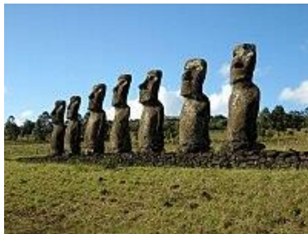
▲全島僅有一處面海的摩艾石像群。

大約在十世紀到十六或十七世紀的歲月裡，島民開始修建大量的巨型石像：摩艾（Moai），這些石像與島民的宗教與祭祀活動有著密切的關係。像這樣的石像一共製造 900 多個，它們每一個都高 7-10 公尺，重量從 20 噸到 90 噸，最重的竟然達 200 噸。根據研究推測，島上有火山噴發形成的凝灰岩與火山岩，島民們用玄武岩製成的斧頭加工而成，再用哈兀哈兀樹纖維製成的繩索，以及棕櫚樹製成的木橇杆，把石像運送到全島各地並豎立起來。