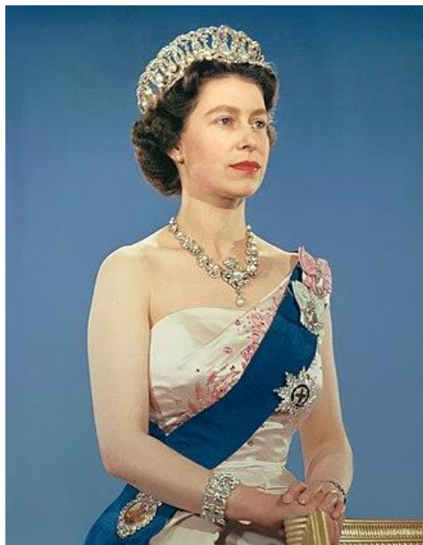
1959 年以英國君主身份拍攝的官方肖像

女王的身體一向健康，年紀漸長難免多了病痛。去年(2021 年) 4 月，與她結婚已 47 年的丈夫菲利普親王離世，女王失去長期的伴侶，哀痛下身體也日漸虛弱，一年多後走下人生舞台。