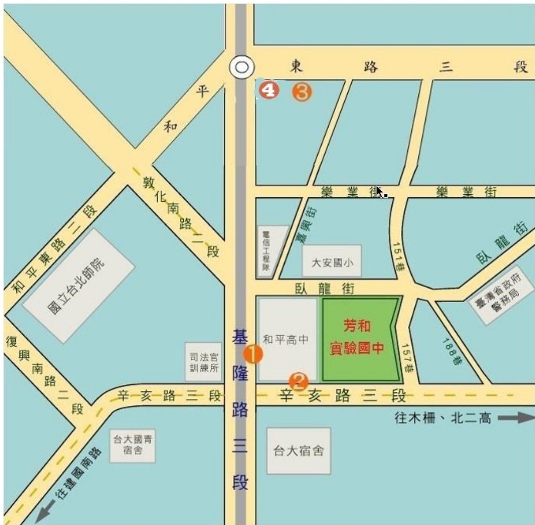
(四)芳和實中交通位置圖