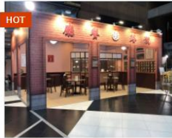
HOT 2022鐵路便當節 2022-06-10~2022-06-13 台北車站多功能展演廳1樓 📍...📍 直線距離 1.39 公里