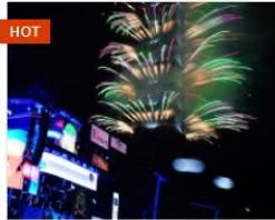
HOT 臺北最HIGH新年城-跨年晚會 2022年時間未定 臺北市市民廣場 📍...📍 直線距離 6.02 公里