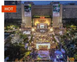
HOT 臺北馬拉松 2022年時間未定 臺北市市民廣場 📍...📍 直線距離 6.02 公里