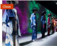
Close 2022臺北時裝週 AW22 : 3/24-3/28 松山文創園區 📍...📍 直線距離 5.58 公里