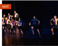
HOT 2022 TIFA台灣國際藝術節 2022-02-17~2022-05-18 國家兩廳院 📍...📍 直線距離 2.49 公里