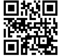
臺北市中山國小 QR Code