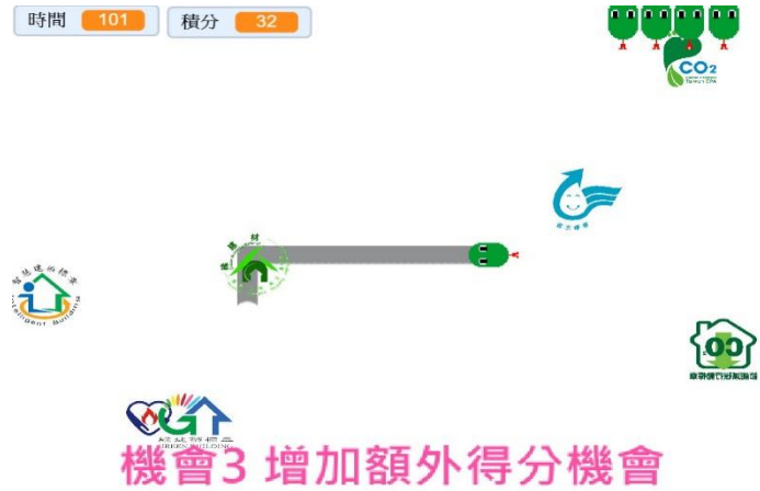
機會3 增加額外得分機會