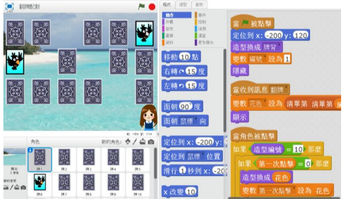
圖7 「翻牌配對」遊戲設計之參考圖