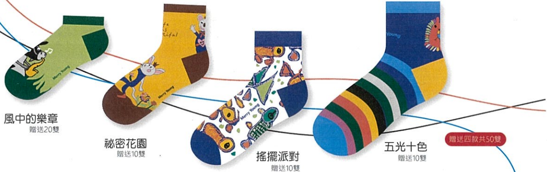
風中的樂章 贈送20雙