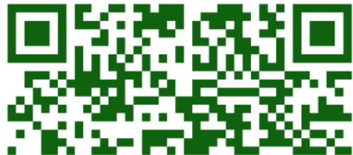
110上安親班入校接送人員健康聲明書