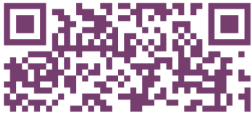
110上安親班防疫檢核表