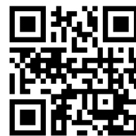
臺北市中山國小 QR Code