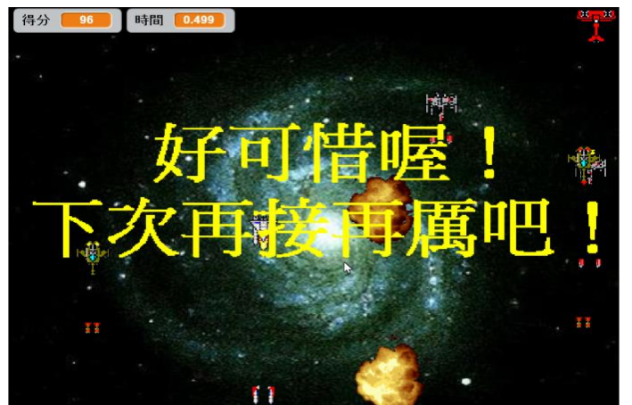
圖9 「星際大戰」遊戲設計之參考圖