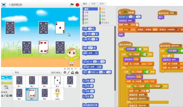
圖6 「翻牌配對」遊戲設計之參考圖