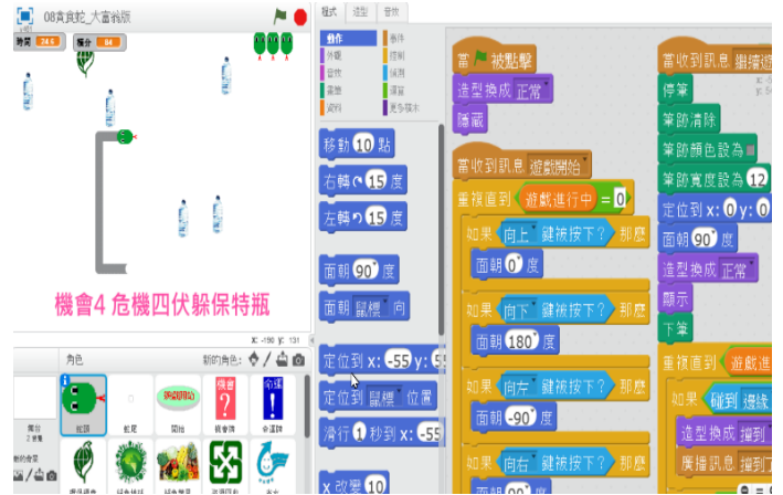
圖5 「貪食蛇」遊戲設計之參考圖