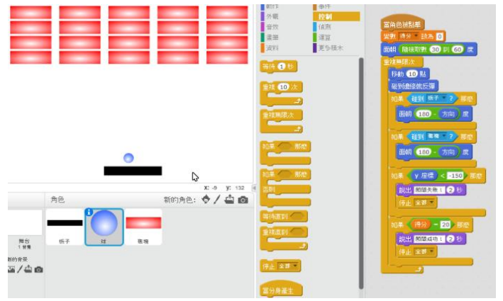
圖3 「打磚塊」遊戲設計之參考圖