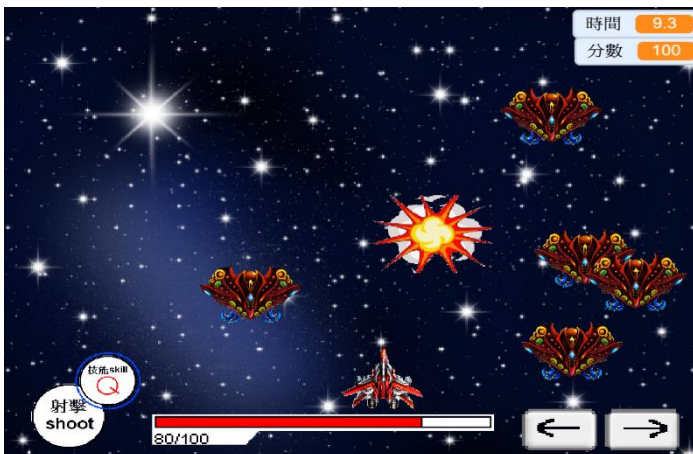
圖8 「星際大戰」遊戲設計之參考圖