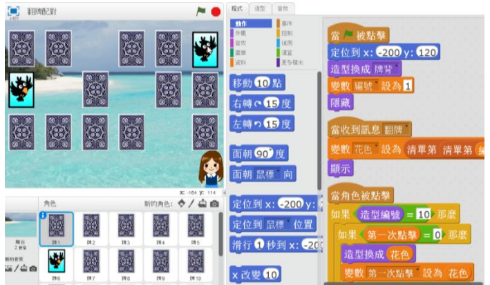
圖7 「翻牌配對」遊戲設計之參考圖