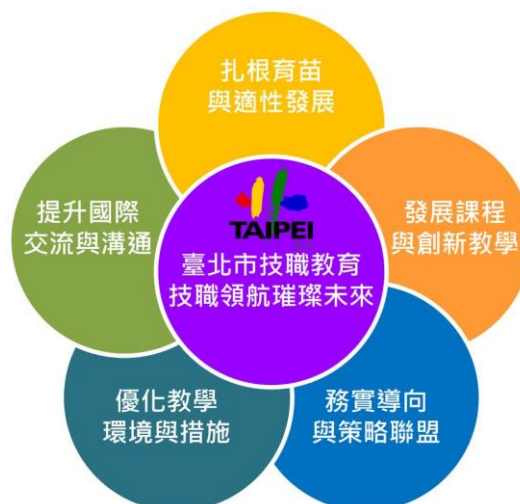
圖 2、臺北市技職教育發展願景

臺北市技職教育政策之推動，將以系統性的思維、整體的規劃及完善的配套措施建構發展願景，如圖 2 所示。培養孩子在專業知識理論外的「非認知能力」，未來強調非認知部分的教育重點，包括跨域及統整運用，掌握方向及目標。