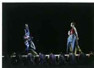
獲選 112 年全國學生舞蹈比賽 特優團隊展演 《記憶光廊》 蘇家賢老師 編舞