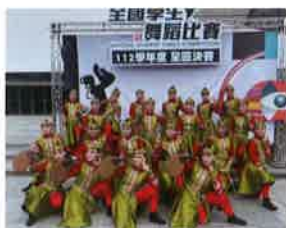
112 學年度全國學生 舞蹈比賽團體民俗舞優等 《颯然》 蘇家賢老師編舞 程偉彥老師指導