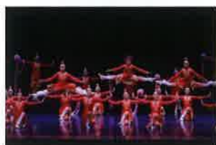
110 學年度全國學生舞蹈比賽團 體民俗舞特優 《喜悅拊舞》 冷靜老師 編舞