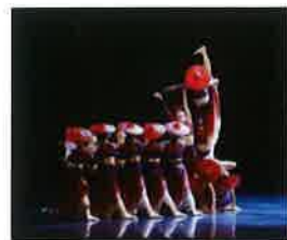
111 學年度全國學生舞蹈比賽 團體民俗舞特優 《山·魅》 蔡宜靜老師 編舞