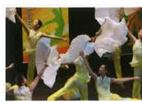
臺北市立雙園國中 校慶演出《清新》 冷靜老師 編舞