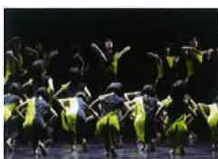
臺北市國民中小學藝術才能 舞蹈班教學成果發表會 《Miss V》 程偉彥老師 編舞