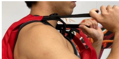
1 肩膀左右各1條帶子拉緊