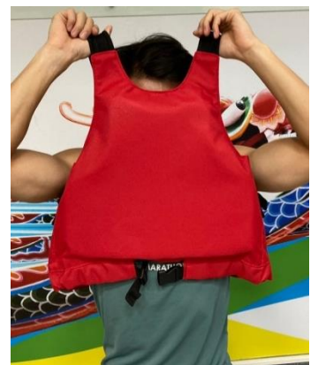
將下方帶子鬆開、扣環打開，即可脫下救生衣