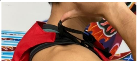
2 順勢往上一推，即可放鬆帶子