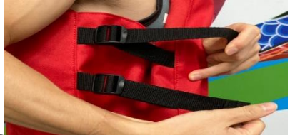
2 腰部左右各2條帶子拉緊