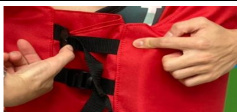
3 腰部兩側扣環，如步驟1操作