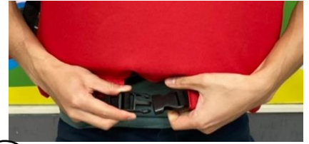
3 正面下方扣環扣好