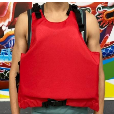
套入救生衣，無字為正面，下方有扣環