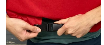
4 扣環扣好後，帶子拉緊