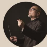
指揮 | 鄭立彬