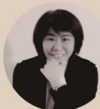
作曲 | 潘家琳